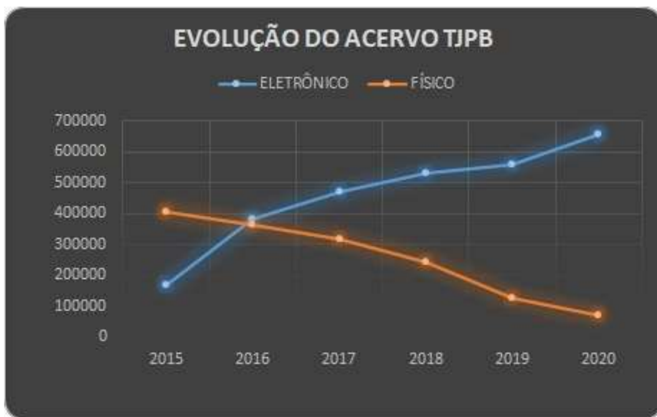
Gráfico 2 - Evolução do acervo eletrônico e físico do TJPB.

Seguindo as determinações emanadas do CNJ, o TJPB confirma em números o que foi normatizado, promovendo uma digitalização de 90,0% semelhante aos índices do CNJ, 2020 apresentados no Gráfico 2.