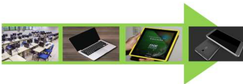
Figura 1: Aparelhos protagonistas nos programas / projetos citados

Borba e Lacerda (2015), ao analisar algumas políticas públicas referentes às tecnologias digitais na educação propõe, a partir do PROUCA, o projeto Um Celular por Aluno, como forma de incorporar os celulares inteligentes com internet às salas de aula. Apesar de não se ter em nível nacional um programa governamental que ofereça aos alunos smartphone para que seja utilizado com fins educacionais, esse esboço de projeto apresentado no III Fórum de Discussão: Parâmetros Balizadores da Pesquisa em Educação Matemática no Brasil, pelos pesquisadores Borba e Lacerda (2015), propõe que as tecnologias não fiquem isoladas da sala de aula, conforme ocorria com os computadores no laboratório, mas que sejam incorporadas dentro da dinâmica dela. Os laboratórios de informática, neste sentido, são vistos como uma extensão da sala de aula, contudo não fazendo parte dela, o que caracteriza estes espaços como uma adoção limitada das tecnologias digitais na educação, diferentemente dos dispositivos móveis que podem fazer parte da sala de aula do estudante. Na figura 1 elencamos os aparelhos tecnológicos que protagonizaram o caminho das tecnologias educacionais apresentado até aqui.