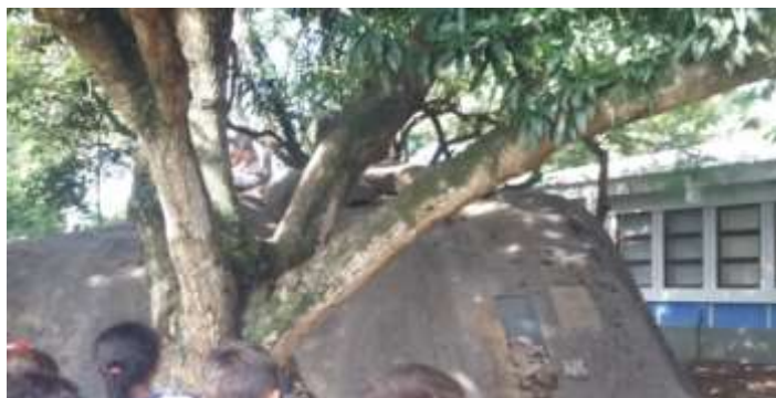
Figura 2 – “Caverna”.