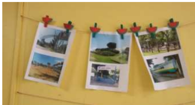
Figura 3 – Imagens de parques da Grande Vitória.

Parque Botânico da Vale, 6 os quais são frequentados por muitas das crianças das turmas, para mostrar que os parques têm nomes.