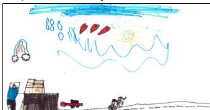
Figura 6 – Cidade onde o pai de Cristiano Ronaldo mora.

Fonte: Desenho produzido por Cristiano Ronaldo, 5 anos. Arquivo de campo.