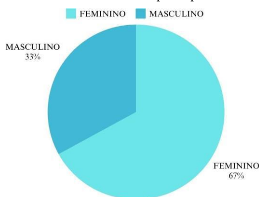
Gráfico 1 - Sexo dos participantes.

O presente estudo procurou retratar o conhecimento e opinião dos discentes do curso tecnólogo e técnico em radiologia no Centro Universitário de Patos - UNIFIP e da Escola Técnica de Ciências da Saúde de Patos - ECISA respectivamente, a partir dos dados fornecidos com um total de 30 (trinta) participantes responderam a um formulário com 8 (oito) questões como demonstra o Gráfico 1.